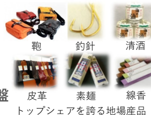
皮革 素麺 線香 トップシェアを誇る地場産品