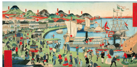
摂州神戸海岸繁栄之図