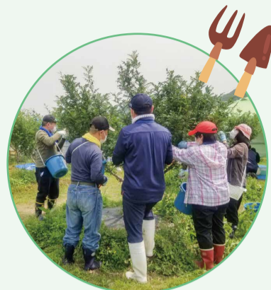
マッチングによる農作業の実施