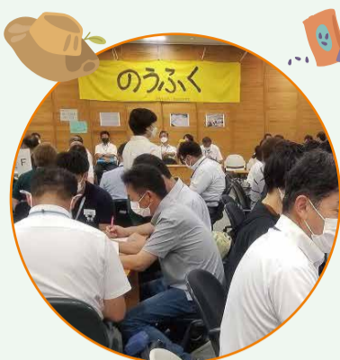
農福連携ネットワーク会議in西播磨の開催

☎0120-83-7830(携帯電話からは代表番号へ) 【受付】平日(祝日等を除く)9時~17時30分