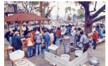
⑧6階部分が崩壊した神戸市役所⑨ 棚が倒れ書類が散乱した県庁議会図書室⑩長田区での炊き出しの様子