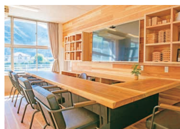
木のぬくもりが感じられるショールーム。

⑧FOREST DOOR-旧神楽小学校- ⑨丹波市青垣町文室244 ⑩0795-87-5511 ⑪0795-87-5566