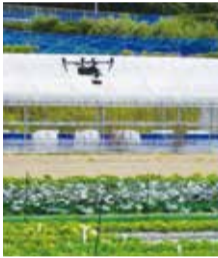
▲ドローンを活用したレタスの生育予測