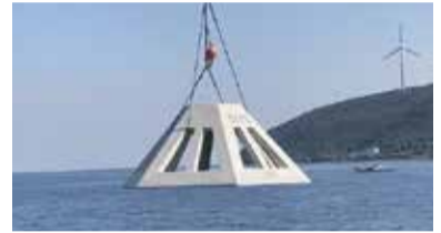
▲稚魚の隠れ場となる魚礁の設置