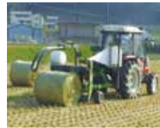
▲牧草のラッピングマシン

また、近年続いている猛暑対策として、暑さによる牛の死亡数を減らすための機器導入も支援しています。