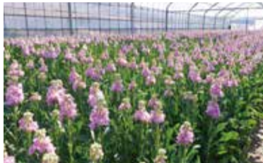
▲ポリウムのある淡路島のストック

カーネーション、ストック、キクなどの生産性を強化するため、生産技術や体制確立に向けた指導をするとともに頭上灌水設備(スプリンクラー)など新技術の導入を支援しています。