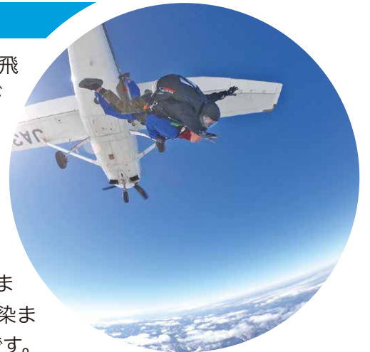
滞空時間は約6分。360度のパノラマビューは爽快そのもの。

インストラクターと2人1組で飛ぶタンデムスカイダイビングが体験できる西日本で唯一の施設。約4,000m上空からは季節ごとに表情を変える但馬の山並みや、青く輝く日本海が一望でき、天気が良ければ富山県の立山連峰や鳥取県の大山まで見渡せるそう。山々が紅葉で染まる秋は特にオススメのシーズンです。