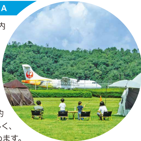
エンジンやプロペラの音、滑走路を走る振動を肌で感じられる距離。

2017(平成29)年、空港敷地内の芝生広場にオープン。滑走路が目の前にあり、日本で唯一、飛行機の離着陸を見ながらキャンプができる場所です。テントや寝具等はレンタル可能で、バーベキューコンロ、食材などが付くプランも。標高約200mに位置するため夜は涼しく、晴れた日には満天の星空が望めます。