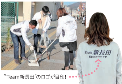
"Team新長田"のロゴが目印!