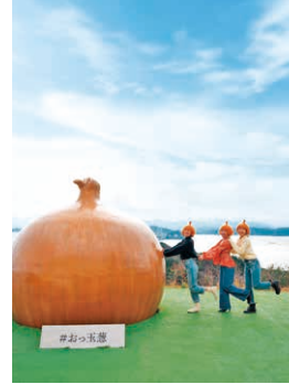
南あわじ市にある巨大なタマネギのオブジェ「おっ玉葱」。

兵庫県の「テロワール」を学んで、深めるオンライン研究所「テロワールlab.」を開設。テロワール旅を感じられる県内の食、景色、人、地場産品などの写真を「#兵庫テロワール旅」を付けてInstagramで投稿し、「ベストテロワール投稿」に選ばされると、商品が進呈されます。