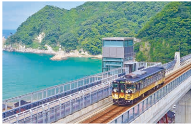
城崎温泉駅-餘部駅間を運行する「うみやまむすび」。

大人気の「WEST EXPRESS 銀河」、鉄道ファンに愛される「サロンカーなにわ」を使用した「兵庫テロワール旅号」、日本海の絶景を楽しむ「うみやまむすび」を特別運行。停車駅では、特産品の販売やその土地ならではのおもてなしに出合えます。