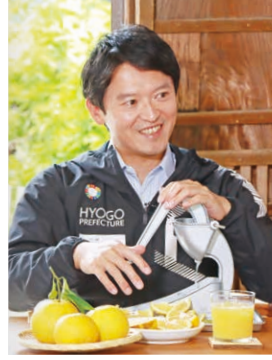
生搾りに挑戦。果汁はすっきりとした味わいでおいしかったです。