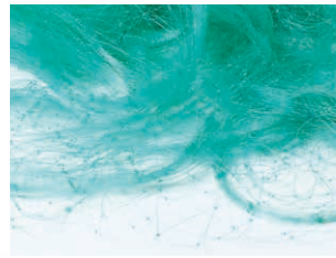
カラーはオーシャンブルー(左)、ディープブルー(右)など。

日本ケミカルシューズ工業組合 ☎078-641-2525 📠078-641-2529