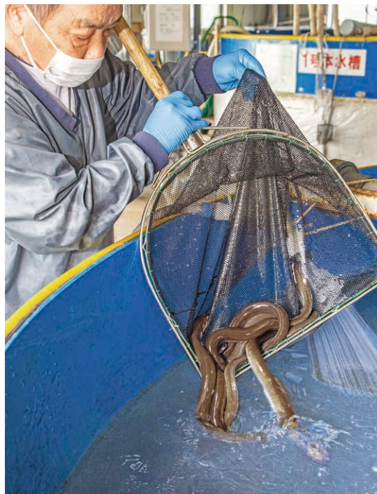
現在約4,000匹を養殖しています。

2017(平成29)年、荷積みや輸送技術など運送業のノウハウと地元産の酒米・山田錦を生かしてウナギの養殖を始めました。ウナギは非常にデリケートで、できるだけ揺らさず短時間で運ばなくてはなりません。インドネシアから輸入した稚魚は、関西国際空港から細心の注意を払って三木市吉川町にある養殖場へ輸送。水槽の水は25度、ろ過して常にきれいに保っています。餌