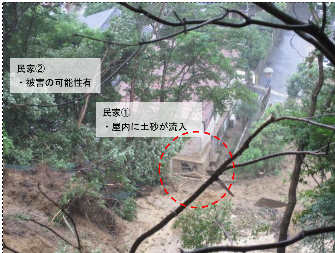
民家② ・被害の可能性有