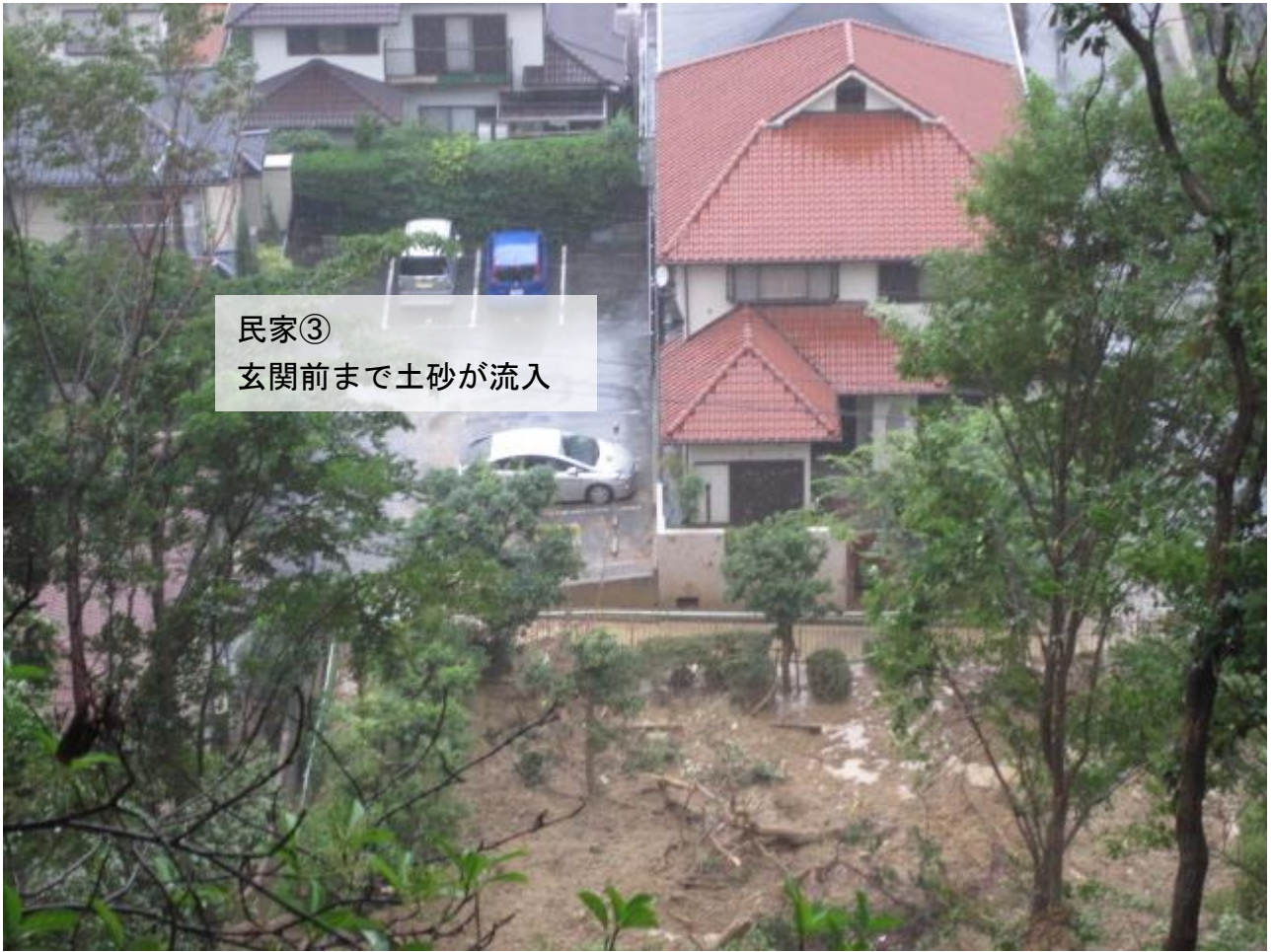
民家③ 玄関前まで土砂が流入