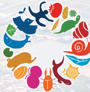
いなみ野ため池ミュージアム SDGs活動のロゴ