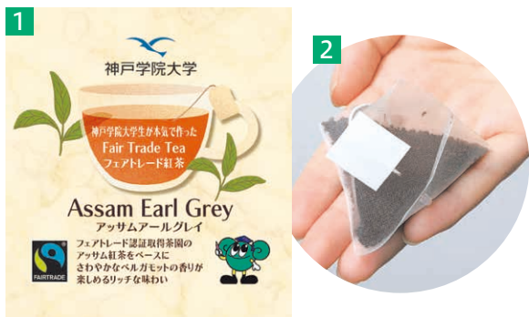
1 パッケージは人の目に留まるデザインを心がけ、神戸紅茶(株)のアドバイスも受けながら改良を重ねました。裏面にはフェアトレードについて記した文章も。1個150円。2 茶葉の抽出効率が良いテトラ型のティーバッグを採用。

コアメンバーの皆さん。資金はクラウドファンディングで募り、9月に目標額を達成しました。