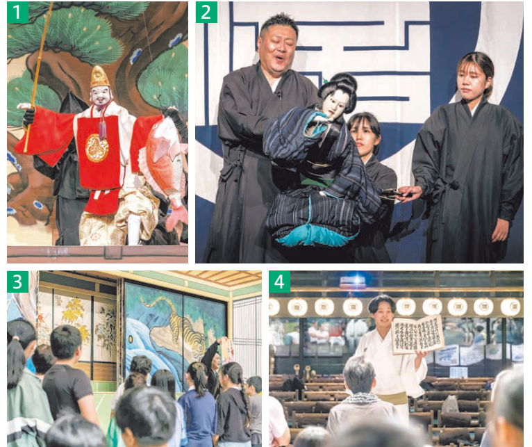
1 国生み神話ゆかりの「戎舞」は淡路人形座の代表的な演目です。2 人形遣いの中でも、頭と右手を動かす「主遣い」は最も技量が求められます。3 淡路人形座名物“大道具返し”の実演。4 太夫による浄瑠璃本の解説も。