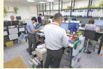
1895(明治28)年創業の金網・パンチングメタルメーカー。現在、3人が奨学金返済支援手当を受けています。

今年の初め、入社2年目の社員から「県の奨学金返済支援制度を利用できないか」と社長に問い合わせがあり、ただちに制度の利用と奨学金返済支援手当の導入を決定。4月に運用を開始しました。ひょうご産業SDGs認証企業とミモザ企業の認定を受けているため補助期間は最大17年間と、制度をフルに活用できます。返済の負担が軽くなった社員は「心の余裕が生まれた」、今回の拡