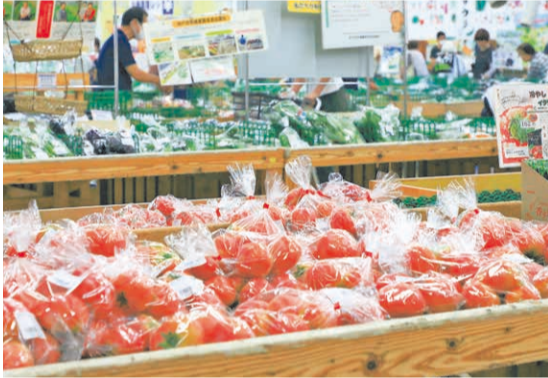
近郊の生産者が登録する神戸市西区の農協市場館「六甲のめぐみ」。9月は特産のイチジクが最盛期を迎えます。

農産物直売所には地元で取れた新鮮な旬の野菜や果物がずらりと並び、多くの買い物客でにぎわいますが、兵庫の農業は生産者の半数近くを70歳以上が占めているのが現状で、将来的に今の