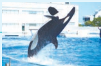
神戸須磨シーワールド