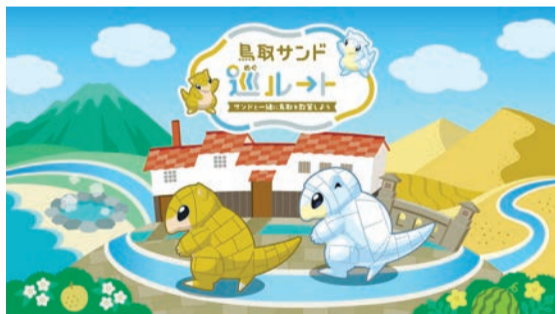
©Pokémon. ©Nintendo / Creatures Inc. / GAME FREAK inc. ポケットモンスター・ポケモン・Pokémonは任天堂・クリーチャーズ・ゲームフリークの登録商標です

公式ルートをプレーして応募すると、もれなくオリジナルスマホ壁紙をプレゼント。さらに抽選で、旅行券やポケモン「サンド」とコラボした特製グッズが当たります。サンドたちと一緒に鳥取県を巡る旅に出かけましょう。