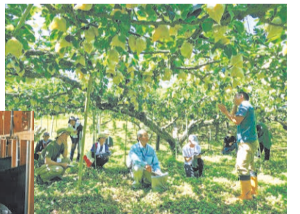
ナシの栽培を学んだ後、牛舎を見学。