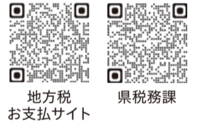
地方税 お支払サイト

※利用に当たっては、所定のシステム利用料が必要です。詳しくは県税務課ホームページで確認してください