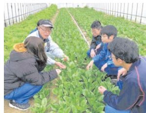
県立農業大学校の実習風景。

有機農業に必要な知識・技術を実践的なカリキュラムに沿って習得できるよう、県立農業大学校に「経営として成り立つ有機農業」を体系的に学ぶコースを新設します。