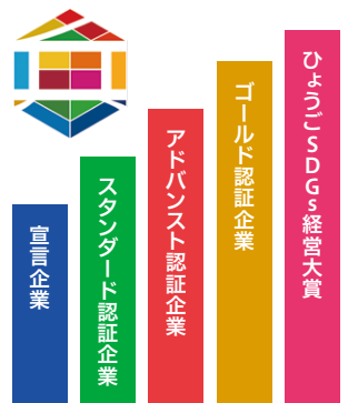
企業のステップアップを支援。

先進事例を発信し、企業のSDGsの取り組みの裾野を拡大するとともに、企業間の交流促進のため、全国的なSDGsプラットフォームに参加します。また、ロールモデルとなる経営者を顕彰する「ひょうごSDGs経営大賞」を創設します。