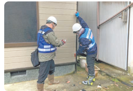
被災者の生活再建に向け職員を派遣(写真は石川県珠洲市での家屋被害認定調査)。

現地連絡員、保健師、建築・土木職員などを派遣し、現地ニーズに応じた支援を実施するほか、被災者に対し県営住宅を提供します。また、ボランティア団体等が現地に赴く交通費や宿泊費を一部負担します。