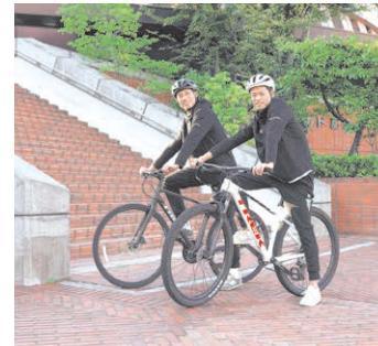
万が一に備え、走行時には必ずヘルメットを着用しましょう。

高齢者に多い特殊詐欺被害を防ぐため、自動録音機能付き電話機等の購入費の補助を継続実施するほか、死亡事故防止に向け交通安全教室を通じた自転車ヘルメットの着用促進などに取り組みます。