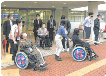
年齢や障害の有無等にかかわらず気兼ねなく旅行できるユニバーサルツーリズムを推進。

「ひょうごユニバーサルなお宿」宣言施設が行うバリアフリー改修を支援するほか、地域を挙げてユニバーサルツーリズムに取り組む観光地を「ひょうごユニバーサルツーリズム推進エリア」に指定し、地域ぐるみの取り組みをモデル的に支援します。