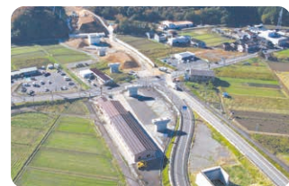
山陰近畿自動車道 浜坂道路II期のトンネル工事等を実施(写真は新温泉浜坂ICの建設状況)。

北近畿豊岡自動車道のほか、山陰近畿自動車道、東播磨道、名神湾岸連絡線、大阪湾岸道路西伸部、神戸西バイパスなどの早期整備を図ります。