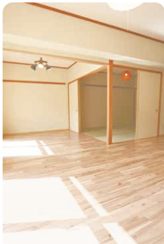
LDK化などの子育て世帯向け改修を施した県営住宅。

阪神間において子育て住宅促進区域を指定し、市町と連携して住宅取得等を重点的に支援。また、県外から阪神間への住み替えを支援します。