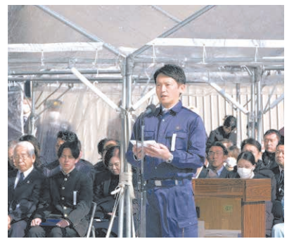
阪神・淡路大震災30年追悼式典等を開催予定。

2025年に30年を迎える阪神・淡路大震災の経験や教訓、これまでの被災地支援のノウハウを生かし、能登半島地震の被災地のニーズに寄り添った支援を引き続き実施します。また、本県の災害対応強化のため、新たに検討会を設置するほか、南海トラフ巨大地震に備えた被害想定の見直し等も行います。