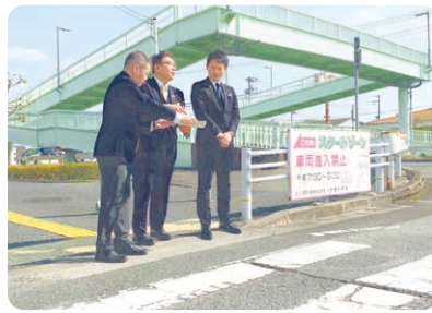
「横断歩道等安全対策プロジェクト」として、横断歩道等の引き直しを早急に進め、県民の安全・安心を守る取り組みを推進(写真は姫路市広畑地区での横断歩道視察の様子)。

地域の関係機関と連携した安全対策と併せ、ハード面の対策として通学路の歩道整備を進めます。また、死傷者数が増加傾向にある横断歩道での事故等を防ぐため、消えかかった横断歩道やセンターラインを引き直します。