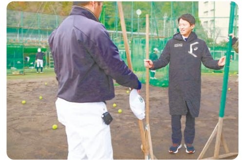
生徒の希望に沿って授業や部活動で使用する用具や備品を購入。

県立高校の部活動等を応援するため、生徒自らが使い道を決める生徒ファースト予算で用具などを購入。グラウンドの芝生も順次進めます。また、選択教室や避難所指定体育館の空調を整備します。