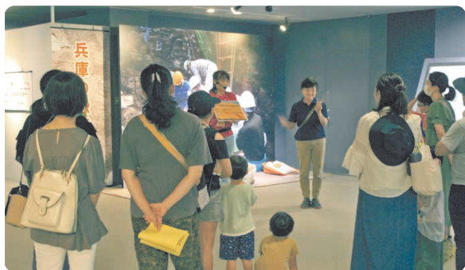
手話通訳付きの展示解説会などを実施。

美術館や博物館を無料開放する「ひょうごプレミアム芸術デー」をさらに充実。障害のある人や子育て世帯に配慮した取り組みに加え、新たにナイト・ミュージアムや子ども学芸員体験なども取り入れます。