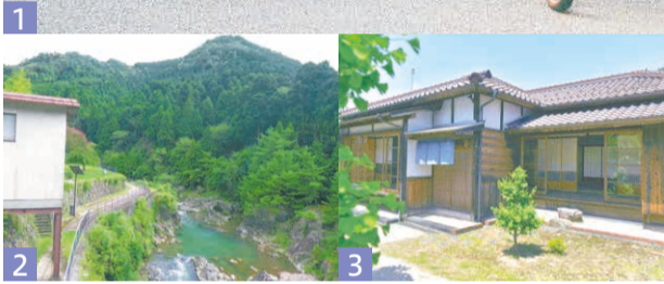
1 古い民家が連なるまち並みを自転車で巡ります。2 市川沿いには生野銀山からの鉱石輸送用のトロッキ道が続きます。3 宿泊体験ができる朝来市旧生野銀山職員宿舎甲9号。朝来市の有形文化財に指定されています。

朝来市のひょうごフィールドパビリオンを体験。「Asagoで暮らす旅」のプログラムを運営する南アフリカ出身のケビン・ネルさん、レハン・ネルさん兄弟に話を伺いました。