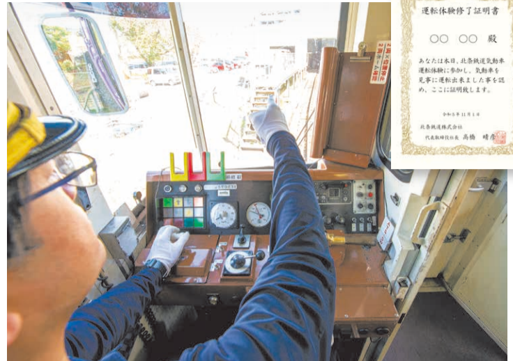
制帽をかぶり、手袋をはめて出発進行!指定の位置でピタリ停車に挑戦します。体験後、修了証明書をもらえます。