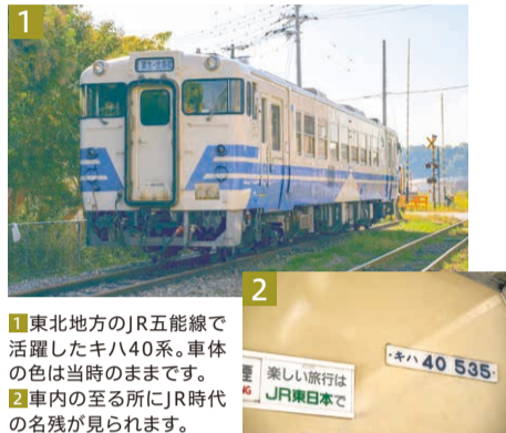
1 東北地方のJR五能線で活躍したキハ40系。車体の色は当時のままです。 2 車内の至る所にJR時代の名残が見られます。