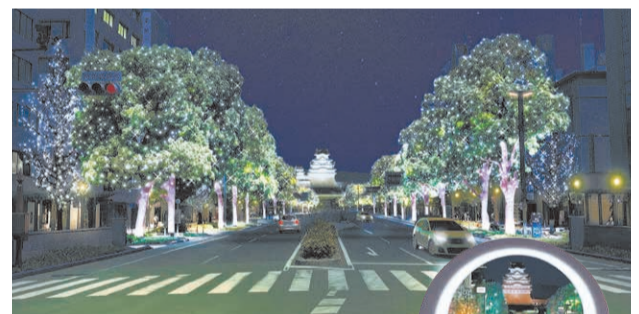
JR姫路駅から姫路城へと延びる大手前通りでも、24年2月29日(日)までイルミネーションを実施。特製モニュメントも設置されます。

鏡花水月 ①12月11日(日)まで17時45分~21時15分 ②姫路城三の丸広場 ③一般500円、中学生以下無料 ④姫路市観光課 ⑤079-221-1500 ⑥079-221-1527 ⑦姫路城30周年記念事業