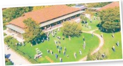
JR東加古川駅から徒歩約15分の立地です。