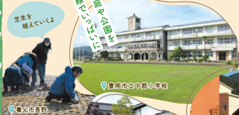
豊岡市立中筋小学校