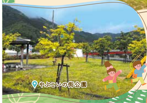
やぶこいの街公園