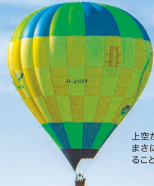
上空から眺める山並みはまさに絶景。雲海が現れることも。

●一般3,500円、65歳以上・中学生以下2,500円、3歳以下無料 ※7日前までに要予約 ●神鍋そらんど ●0796-45-1545