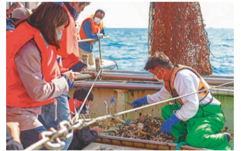
漁師が底引き網で取れた魚介類を説明してくれます。