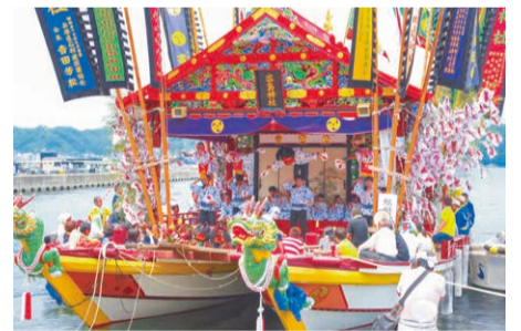
7月の家島天神祭で見られる宮だんじり船。