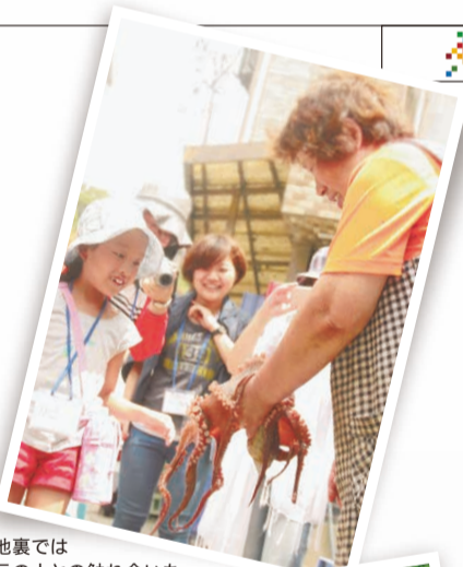
路地裏では 地元の人との触れ合いも。

ひょうごフィールドパビリオンとは 2025年大阪・関西万博に向けて地域の持続可能な未来を実現する活動の現場(フィールド)を展示館(パビリオン)に見立てて発信する取り組み。