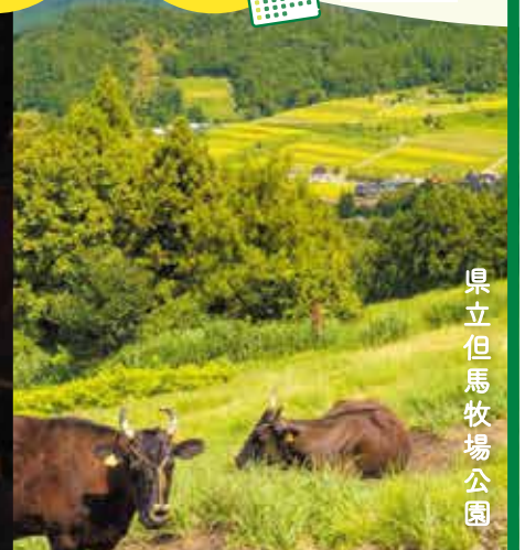
県立但馬牧場公園