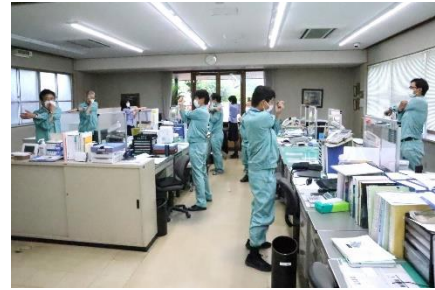
午後3時のストレッチ体操

上記のほか、健康宣言の社内外への発信、管理職・従業員に対する教育機会の設定、食生活の改善に向けた取組、運動機会の増進に向けた取組、女性の健康保持・増進に向けた取組、長時間労働者への対応に関する取組、従業員の喫煙率低下に向けた取組などに取り組んでいます。