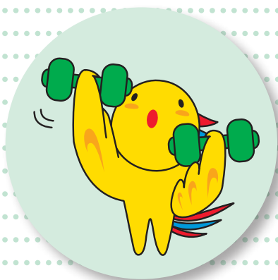
兵庫県マスコット 「はばタン」