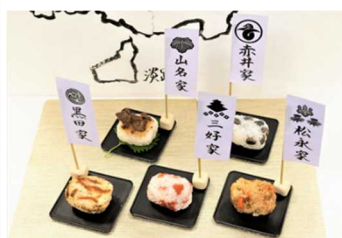
(左) R5 お弁当コンテスト最優秀賞 「兄へのお弁当での疲労回復めし」