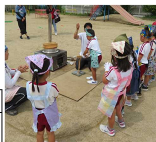
かまどごはん塾の様子

幼児期の子どもとその保護者に対して、「かまど炊飯による感動体験」と「保護者への食育講義」を組み合わせた啓発活動を実施する。