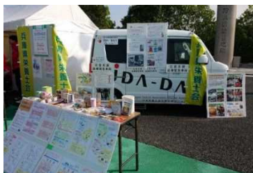
県民へ食の備えについての普及啓発