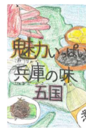
テーマ① 令和5年度最優秀賞 テーマ② (知事賞) 作品