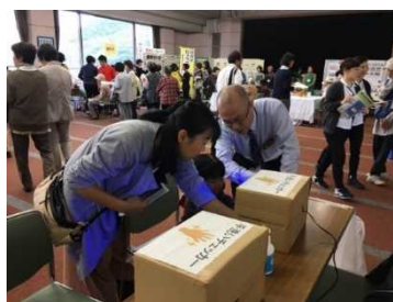
食の安全安心フェアの様子