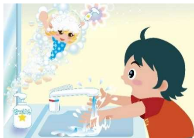
手洗い大冒険抜粋（紙芝居）

* 内容：R 5 年度は、コロナウイルス感染症流行前に実施していた街頭啓発や手洗い体験なども含めて開催した。