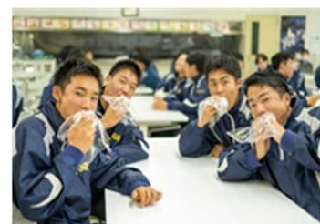
ごはんを頼る高校運動部員

提供を受けた参加部員は部活動の前後にお米を補食し、お米・ごはん食の良さについて啓発、活動内容を報告。その様子をラジオ放送等により周知を図る。