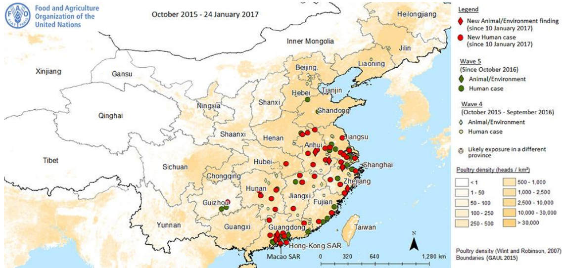
図 3. 中国本土の鳥インフルエンザ A (H7N9) ヒト症例とトリ・環境中の陽性例の報告地域 2015 年 10 月～2017 年 1 月 (文献 11 から引用)