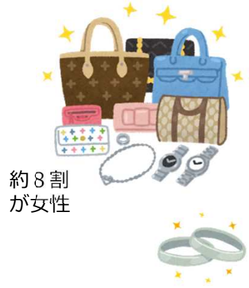
品目別ワースト5（2021年度）