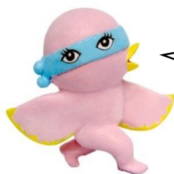
美術館の妖精 ントチャン

お問い合わせ先：兵庫県立美術館こどものイベント係 TEL:078-262-0908