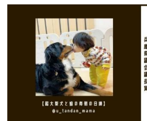
兵庫県議会 企画委員会