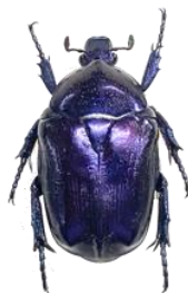
ミリフィカシロテンハナムグリ