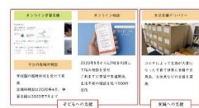
コロナ禍での活動