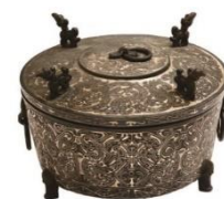
銀象嵌龍鳳紋樽(酒温器) 高16.6cm 径25.4cm(千石氏蔵)