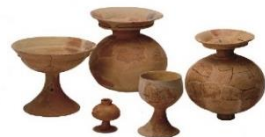
弥生土器 県指定文化財 内場山墳墓群(丹波篠山市)

兵庫県が実施した発掘調査の成果を一堂に公開する展覧会。 今回は、令和2年度刊行の発掘調査報告書に掲載された遺跡と過去に発掘調査を行った遺跡の中から、県指定文化財を中心に選りすぐりの出土品を展示します。