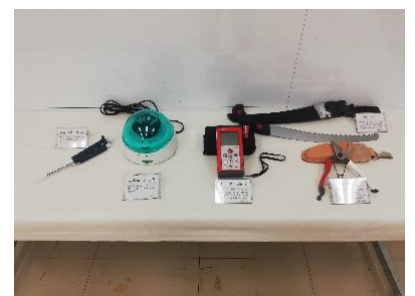
研究員こだわりの研究道具