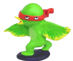
美術館の妖精 イベチャン

「あそんで・みる・ひろば」が 新しくなcame入りしたよ。 夏休みに取り組んでみてね♪