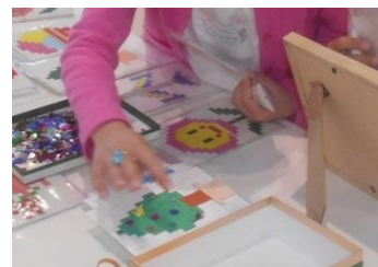
ワークショップ「モザイクアート」

問合せ先：兵庫県立歴史博物館 〒670-0012 兵庫県姫路市本町 68 番地 TEL 079-288-9011 FAX 079-288-9013 http://www.hyogo-c.ed.jp/~rekihaku-bo