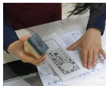
ワークショップ「オリジナル藩札」