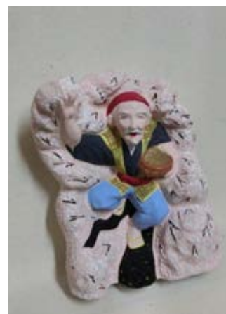
葛畑人形(花咲いさん)