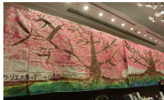
アトリエ太陽の子による作品