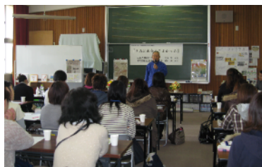
右 里親啓発リーフレット 左 出前講座の様子

11月に市内の幼稚園・小学校のPTA向けに出前講座を実施しました。公益社団法人家庭養護促進協会から里親制度の内容を分かりやすく説明していただいた後、市内の里親さんから体験談や子育てに関するお話をしていただきました。参加者も熱心に耳を傾け、「里親制度がもっと広がってほしい」等の感想が寄せられました。