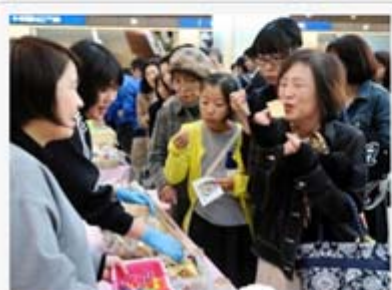
工夫を凝らした出品作を試食する来場者＝神戸市中央区東川崎町1、デュオこうべ