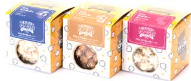
金ゴマクッキー 兵庫県：就労継続支援B型事業所ドリームボール