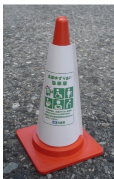
【駐車場での設置例】