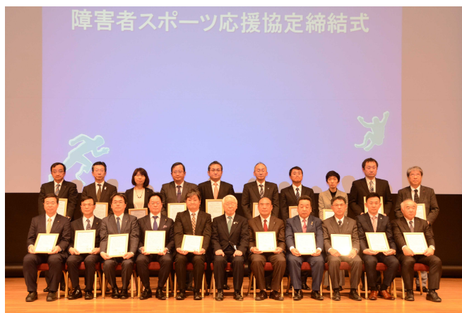
障害者スポーツ応援協定 企業代表者の皆さん

東京2020パラリンピック競技大会に向け、県全体で障害者スポーツを支援する枠組みをつくっていくために、公益財団法人兵庫県障害者スポーツ協会会長（兵庫県知事）は、さまざまなかたちで障害者スポーツの支援を行う県内の大学や企業、団体等との間で、「障害者スポーツ応援協定」を締結しました。それに伴い2月27日（月）、ポートピアホテル・ポートピアホールで開催された「国際義肢装具協会（ISPO）世界大会2019 プレイベント」の一環として、第1回協定締結式が執り行われました。