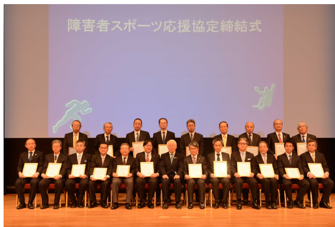
障害者スポーツ応援協定 大学・団体代表者の皆さん