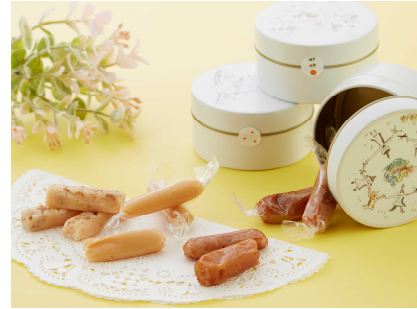
とっとりけん 鳥取県：もりのみキャラメル