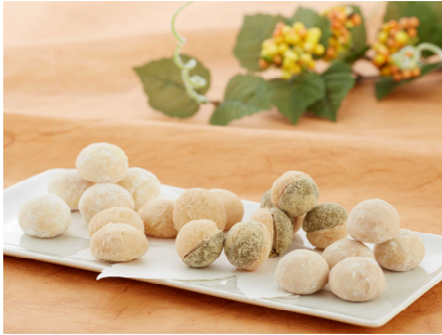
とくしまけん あ わ ばんちゃ 徳島県：阿波晩茶のホロホロクッキー