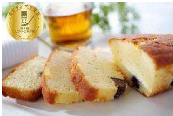
じゃばにーず さけ けーき Japanese SAKE cake

また、11月末から12月末にかけて行われた授産商品販売サイト「+NUKUMORI」において、大会出品商品11商品の人気投票も行われ、次のとおり入賞商品が決定しました。