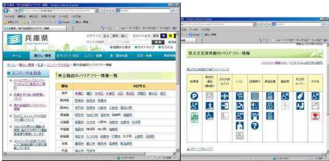
がめん 画面のイメージ