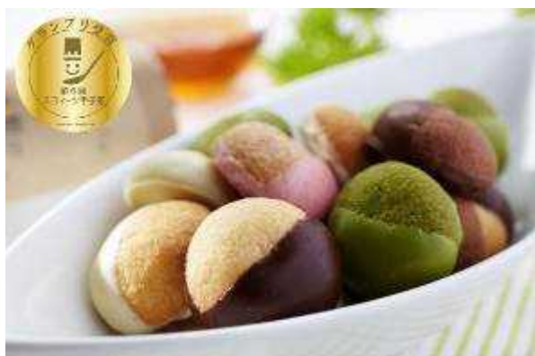
ひびか こめこ Hibica 米粉のポルポローネ