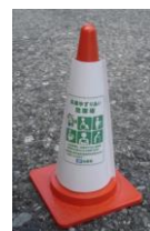
【駐車場での設置例】