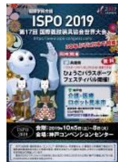
<ISPO 2019 のチラシ>

◆問合せ先 兵庫県健康福祉部障害福祉局ユニバーサル推進課 電話 078-362-9418 FAX 078-362-9040