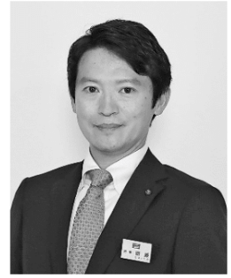
兵庫県知事 齋藤 元彦