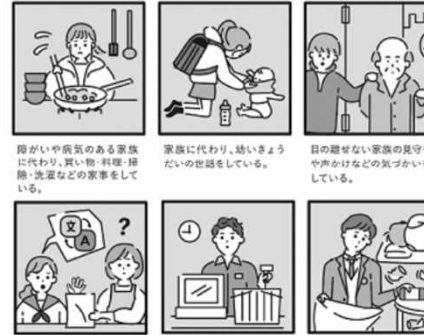
障がいや病気のある家族に代わり、買い物・料理・掃除・洗濯などの家事をしている。 障がいや病気のある家族に代わり、幼い子どもに世話をしている。 目の見えない家族の見守りや声かけなどの気づかいをしている。 日本語が第一言語でない家族や障がいのある家族のために通訳をしている。 家計を支えるために労働をして、障がいや病気のある家族を助けている。 アルコール・薬物・ギャンブル問題を抱える家族に対応している。

※家事や家族のお世話をすることは悪いことではありませんが、毎日のようにお世話をすることで、本当にやりたいことができなかったり、また、そのことを誰にも相談できず、悩んだりしている子どもがいるかもしれません。猪名川町ではそのような子どもたちに、支援を届けたいと考えています。