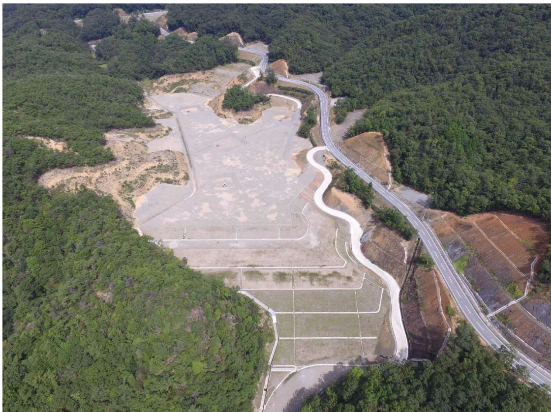
写真-1 造成地（枇杷ノ谷※）