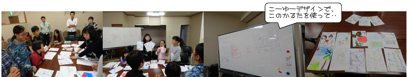
もう一回かるた遊びをします。大人も真剣にやっています。