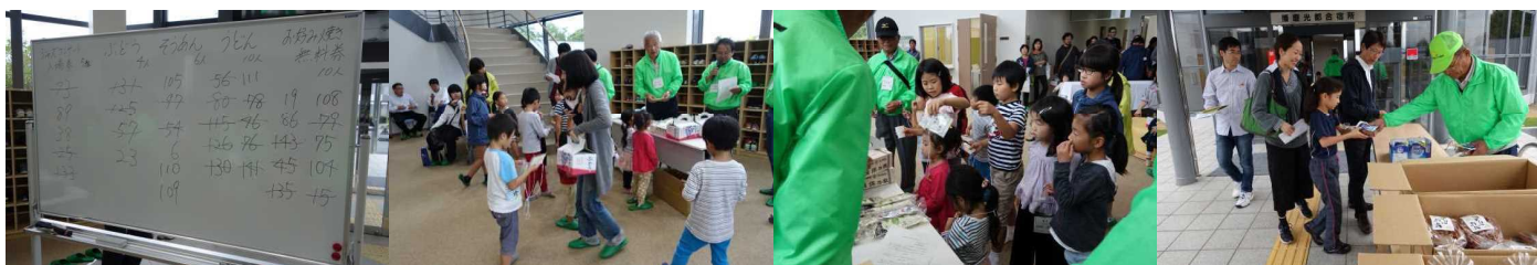
実施にご協力いただきましたみなさま、ご参加いただきましたみなさま、ありがとうございました。