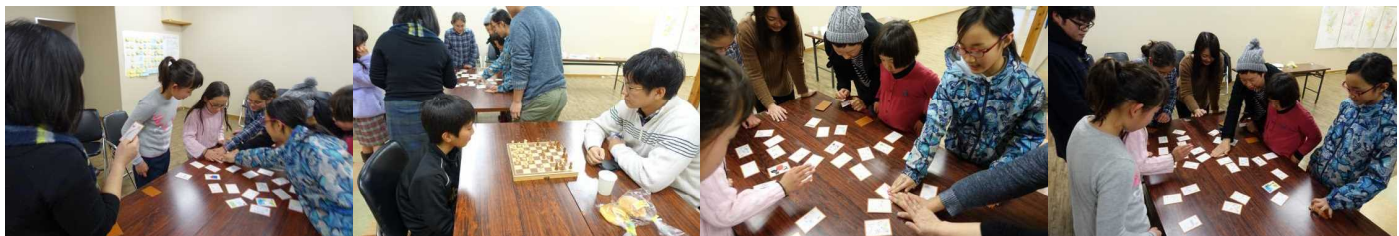
大学生のおにいさんとゲームであそぼう!