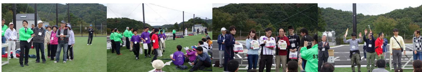
お昼からは、新合宿所の内覧会です。