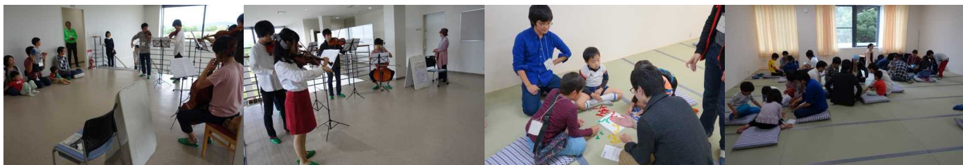
最後に、大抽選会の豪華賞品とおみやげをゲットして解散しました。