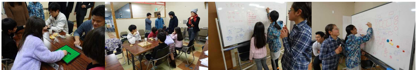
またこの場所であそびましょう。