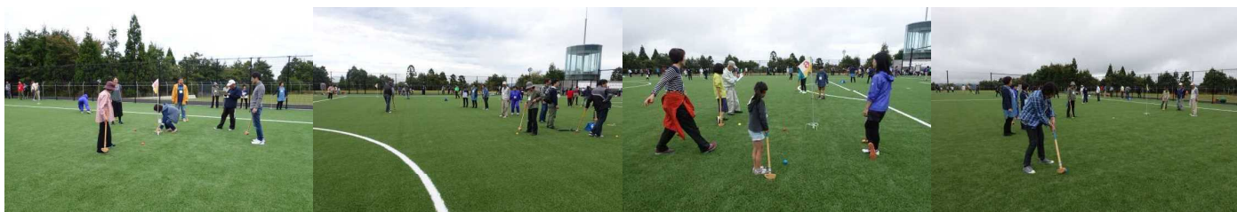
お子さまがたもミニゲームで元気に遊びました。