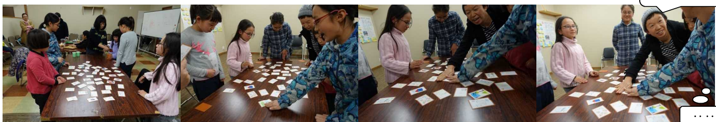
騒がしいかるたあそびチームを横目に静かな干エス勝負。