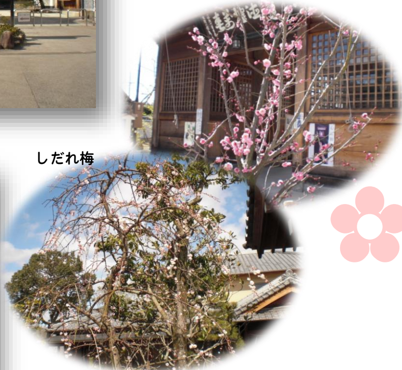
三田八景の1つ 三田天神の約100本の紅白の梅 (三田市天神3丁目34番5号)