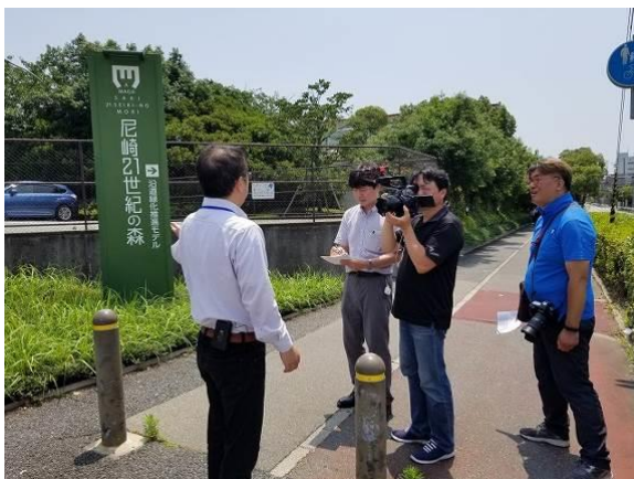
工場の沿道緑化を撮影