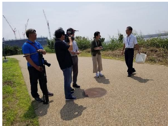
企業の森づくりを見学