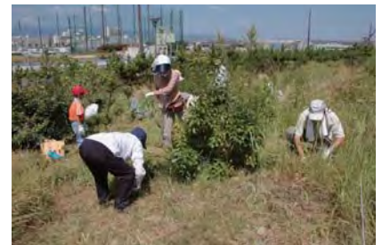
活動エリアの除草