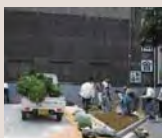
工場のすき間緑化

「尼崎の森中央緑地」周辺の尼崎南部の臨海部では、「尼崎21世紀の森づくり協議会」の4つの部会（森部会、まちづくり部会、産業部会、発信部会）が様々な活動を行っています。部会の仲間も募集しています！