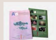
フリーマガジンの発行

協議会へのお問合せはコチラ↓ http://www.ama21mori.net/