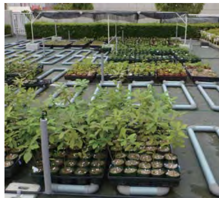
受け入れ企業の育苗施設