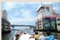
水辺を楽しむ運河博覧会