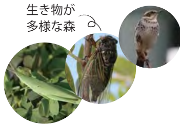
生き物が多様な森