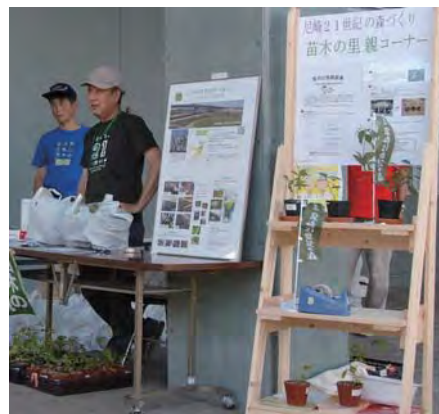
イベント時の苗木の里親募集コーナー