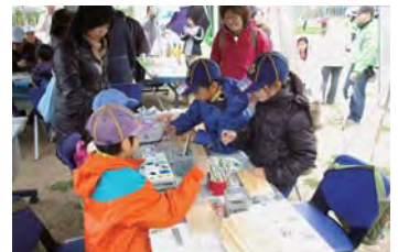
子ども向けイベント