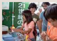
イベント等でのエコクラブ