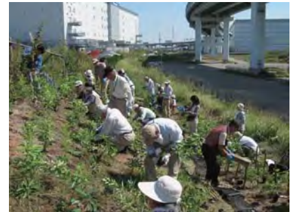
活動エリアへの植樹

エリア設定型の活動の第一歩である苗木植樹の際には、植樹の仕方のアドバイスなど植樹サポートを行います。