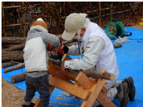
シイタケの菌打ち