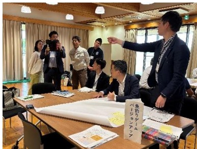
環境学習フェア2025の企画検討の様子