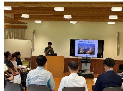
第4回の話題提供の様子