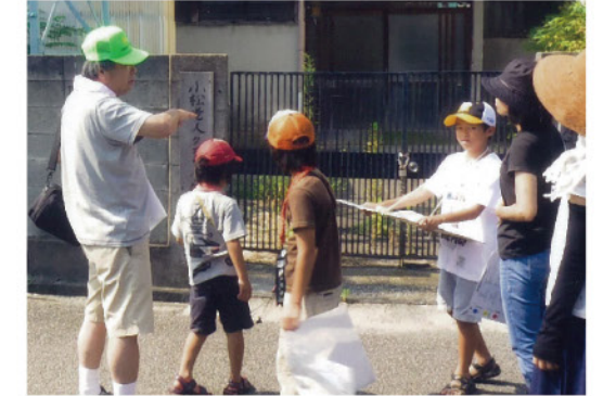
まち歩きの様子(西宮市小松地区)