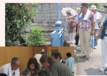
まち歩き・マップ作成状況(三輪区)