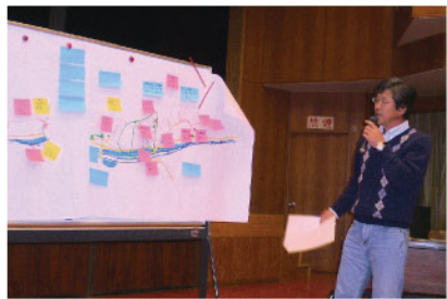
発表の様子(佐用町・徳久地域)