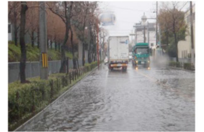
浸水被害(H24年尼崎市)