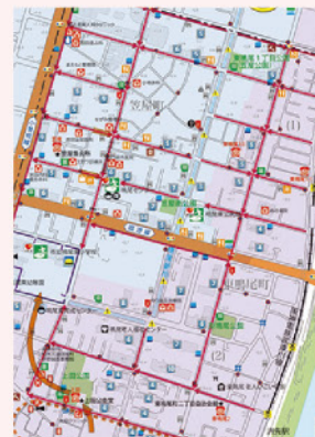
鳴尾東防災マップ

例) 地盤高を詳細に記載すること、 浸水ラインを写真に表示すること、 浸水時に蓋が外れる恐れのあるマンホールの 写真掲載、 3階建て以上の堅牢な建物、 津波による浸水予想区域 など