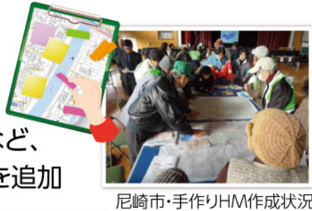
尼崎市・手作りHM作成状況