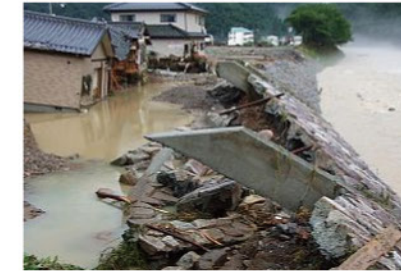
洪水被害(H21年佐用町)