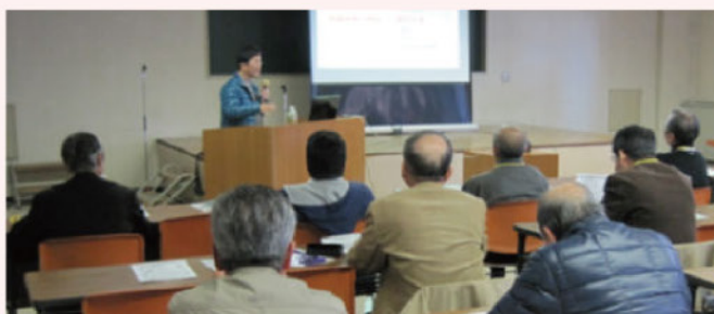
地域における防災力向上講座

「地域における防災力の向上」を目指し、地域防災マップの作成方法の紹介や地域による避難訓練に参考となる災害図上訓練など、実践的な内容の講座を開催しています。