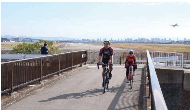
大阪国際空港付近