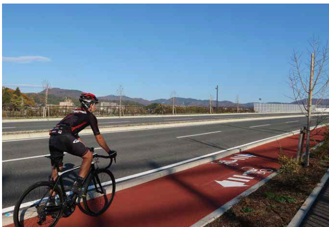
自転車道 (県道川西インター線)