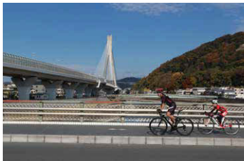
新猪名川大橋 (ビッグハープ)